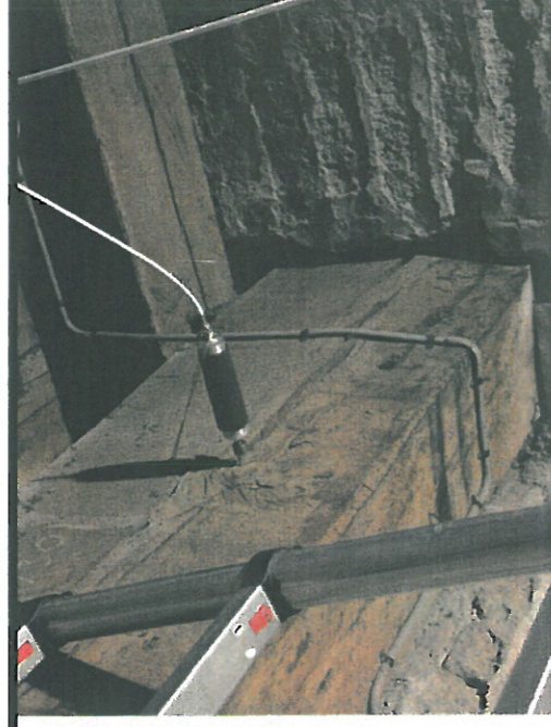
Controle bonte knaagkever in balk in toren.

Voor al historische gebouwen vindt op dit moment een grote omslag plaats ten aanzien van de bestrijding van houtaantasting. Rijk en branche zijn na jaren van overleg tot afspraken gekomen over 'het nieuwe bestrijden', vastgelegd in een uitvoeringsrichtlijn (URL 5001). Het doel is enerzijds om zoveel mogelijk historisch materiaal in origine-